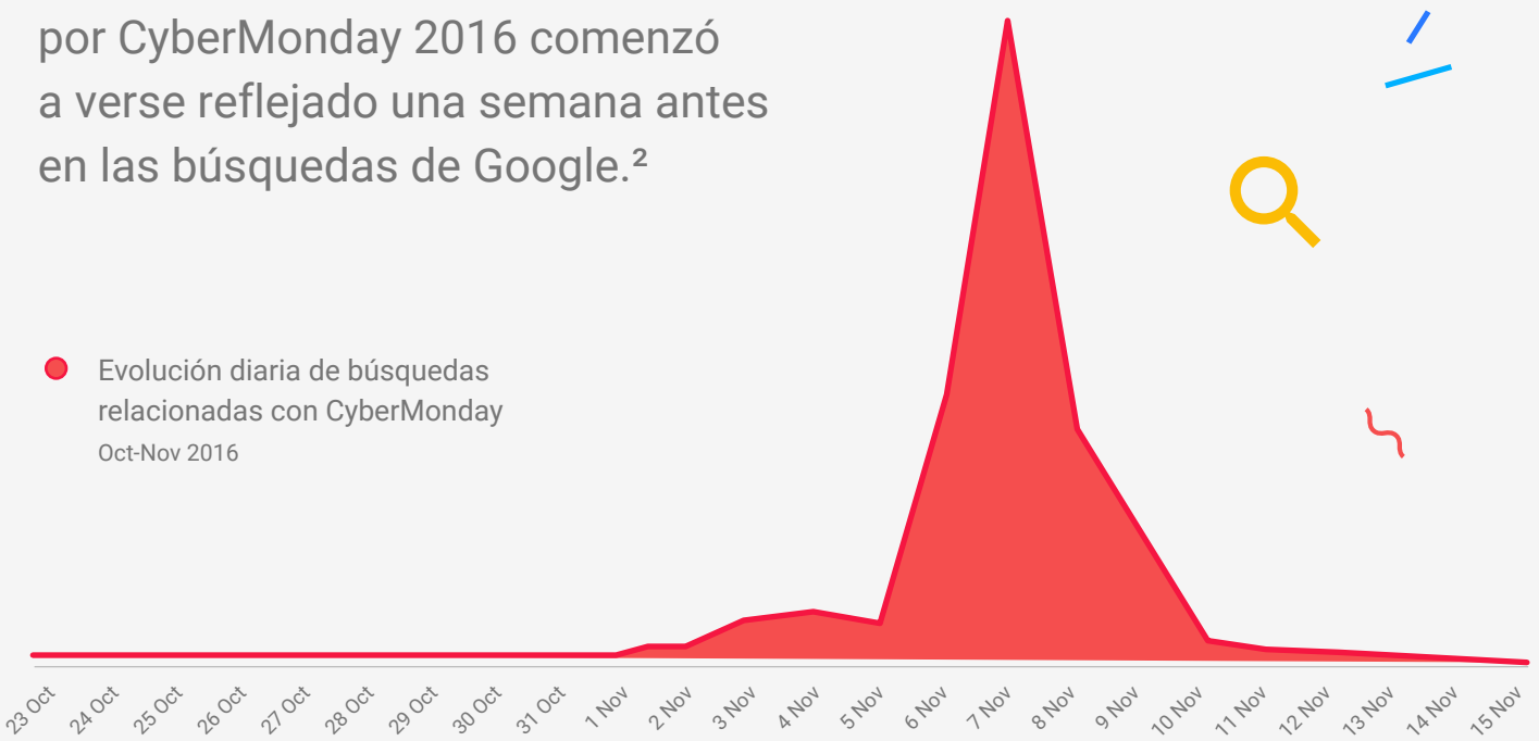
● Evolución diaria de búsquedas relacionadas con CyberMonday Oct-Nov 2016

Las búsquedas relacionadas con CyberDay/ CyberMonday aumentan cada año y el día Lunes sigue siendo el más relevante del evento. 2