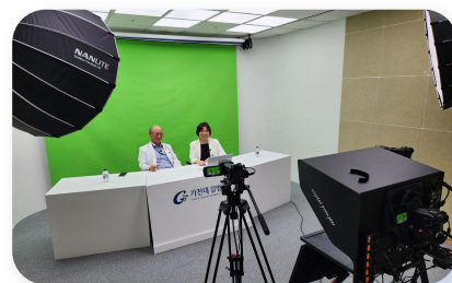
길병원 콘텐츠 제작 스튜디오의 촬영 현장

전용 스튜디오를 갖춘 덕분에 콘텐츠 제작 효율성이 증가했을 뿐 아니라 병원 관계자들 사이에도 YouTube 채널이 중요한 취지라는 인식이 강해졌습니다.