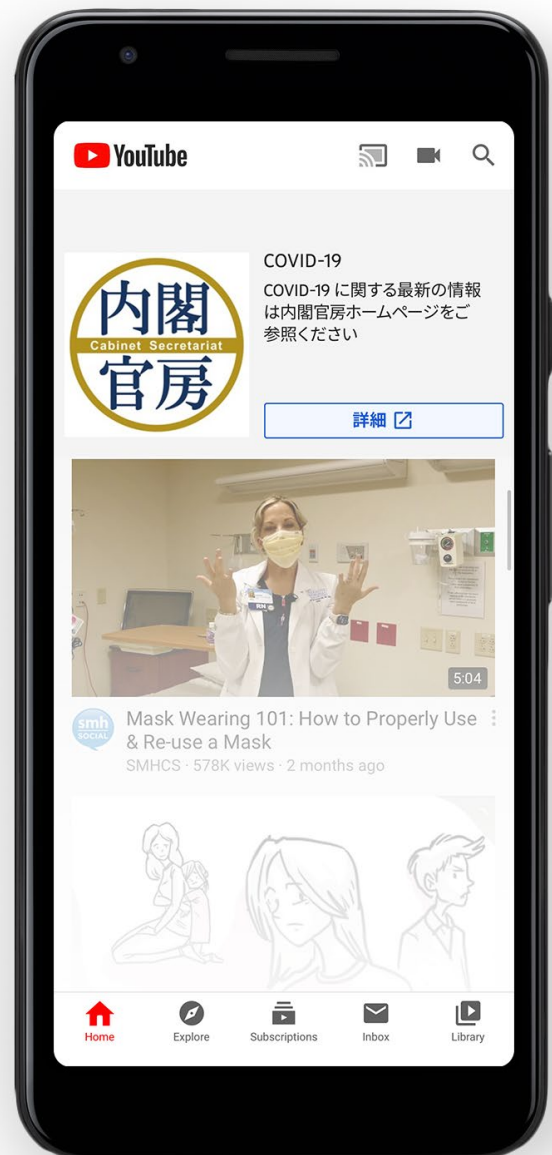
● 情報パネルとトップページのバナー プレースメント

コミュニティ ガイドライン違反ではないものの違反すれすれであるコンテンツは、YouTube のコンテンツの 1% にも届きません。YouTube は 2019 年に、ユーザーに有害な方法で誤った情報を伝える可能性がある、ガイドラインのボーダーライン上のコンテンツや動画が おすすめとして表示される割合を減らす 2 取り組みを始めました。そして、この取り組みのすべてが、 YouTube で COVID-19 に関する誤った情報の拡散を抑制する 3 ための土台となっています。